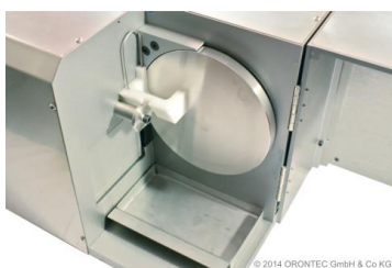
Messprinzip rotierende Scheibe (3 Winkel)

In der High-End Version des Q-Chain® LCM wird eine Farbmessstechnik verwendet, mit der drei verschiedene Winkel aufgenommen werden. Damit können Effektfarben, sowie Komponenten mit Effektpigmenten präzise gemessen werden. Durch den Auftrag des Material auf einer präzise rotierenden Scheibe und einer speziellen Anordnung des Spektralphotometers (Farbmessgerät).